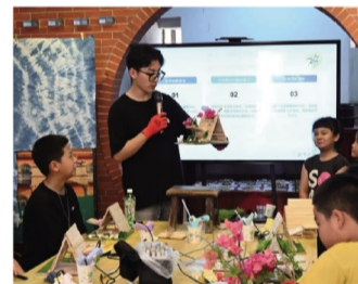
(文 万建军 图 “艺心筑梦”社会实践队)

据悉,本次赛事是第十二届海峡青年节重要活动之一。海峡乡建乡创奖比赛以协同两岸乡建乡创经验为宗旨,致力于发挥年轻人文化创意的力量,与地方共好、共荣,助力乡村振兴发展。今年的比赛共吸引来自海峡两岸的194件作品参赛。